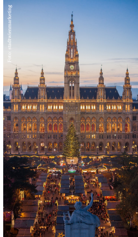
Das Wiener Rathaus

Ende Februar 2019 hat das Innenministerium zwar etwas nachgegeben und erklärt, es erachte die Anerkennung von vor dem 01.01.2019 im Ausland geschlossenen gleichgeschlechtlichen Ehen doch für zulässig, aber erst ab Datum der Antragstellung (auf Anerkennung) und wieder nur für Paare, bei denen beide Teile die Staatsangehörigkeit eines Landes ohne Eheverbot haben. Zudem lässt dieses Rundschreiben des Innenministeriums befürchten, dass es auch nach dem 01.01.2019 im Ausland geschlossene Ehen nur in solchen Fällen (beide Teile mit Staatsbürgerschaft eins Landes ohne Eheverbot) anerkannt wissen will. ●